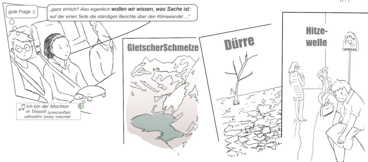
Abb. 3: „Mein Onkel sagt, die Wissenschaftler haben vor 50 Jahren noch vor einer Eiszeit gewarnt... Was stimmt jetzt wirklich?“ –solche Verwirrungen, und wie es dazu kommt, werden im Comic erläutert.

Der Comic selbst steht auf der StartClim-Website unter http://startclim.at zum Download bereit.